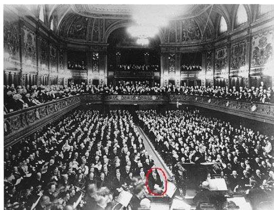
Concert de l'orchestre de Leipzig

. COMMENTAIRE DE TEXTE : Identifiez les raisons de la naissance de la musique atonale.