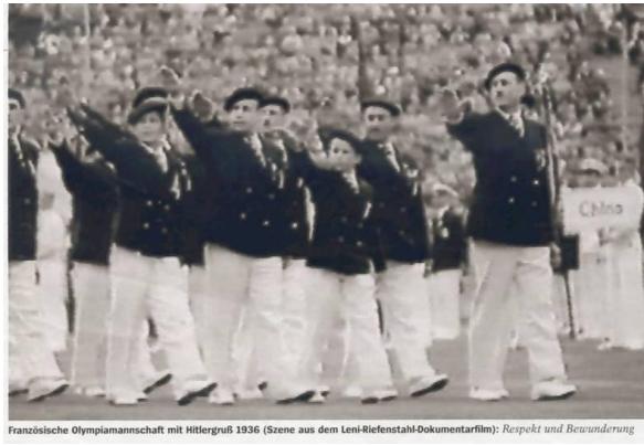
Französische Olympiamannschaft mit Hitlergruß 1936 (Szene aus dem Leni-Riefenstahl-Dokumentarfilm: Respekt und Bewunderung)

ANALYSE VIDÉO : Décrivez les différents plans visuels de cette vidéo et relevez l'esthétique musicale qui les accompagne.